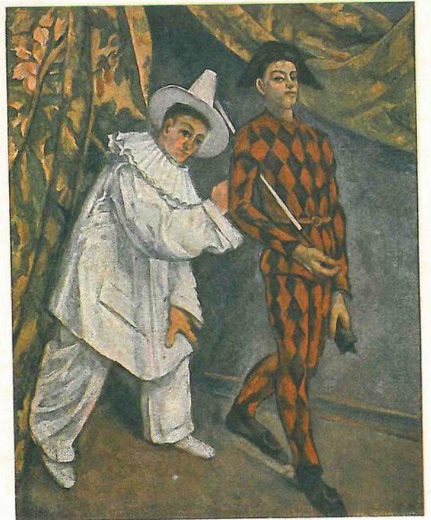
П. Сезанн. „Масленица“

Пользовался ли мастер с самого раннего периода своего творчества аналитическим методом? Не было ли у него эклектического этапа, т.е. этапа „подхода от картины к природе“? Изучение его первого черно-корич-